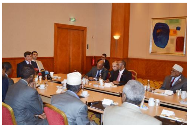
Weftigii Somaliland iyo Soomaaliya, oo uu u dhexeeyo Raysal Wasaarihii Turkiga. Istanbul.

Kulamadii shirarkii wada hadalladu way badnaayeen. Waxaa lagu kulmay UK, Imaaraadka, Turkey, Jabuuti iyo Kenya (oo Informal ahaa). Waxaa la isla gartay arrimo muhiim ah, oo ay ka mid ahayd in loo wada hadlo si siman (Somaliland-Soomaaliya); In la iska kaashado nabadgelyada; In si siman loo qaybsado maamulka iyo dhaqaalaha hawada, Hargeysana laga maamulo; In wixii hadalxumo ah ee dhaawici kara wada hadallada la joojiyo; In wixii