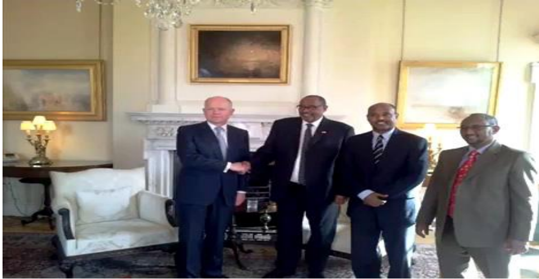
Kulankii Xoghayaha Arrimaha Dibada iyo weftigii Madaxweyne Silanyo

Markii aannu ka soo laabannay shirkii Ankara ee ay madaxweynayaasha Somaliland iyo Soomaaliya ku sexeexeen qodobbadii ka soo baxay wada hadalkii labada dhinac, ayaannu u soo duulnay London oo aannu mar labaad kula kulmi doonno William Hague.