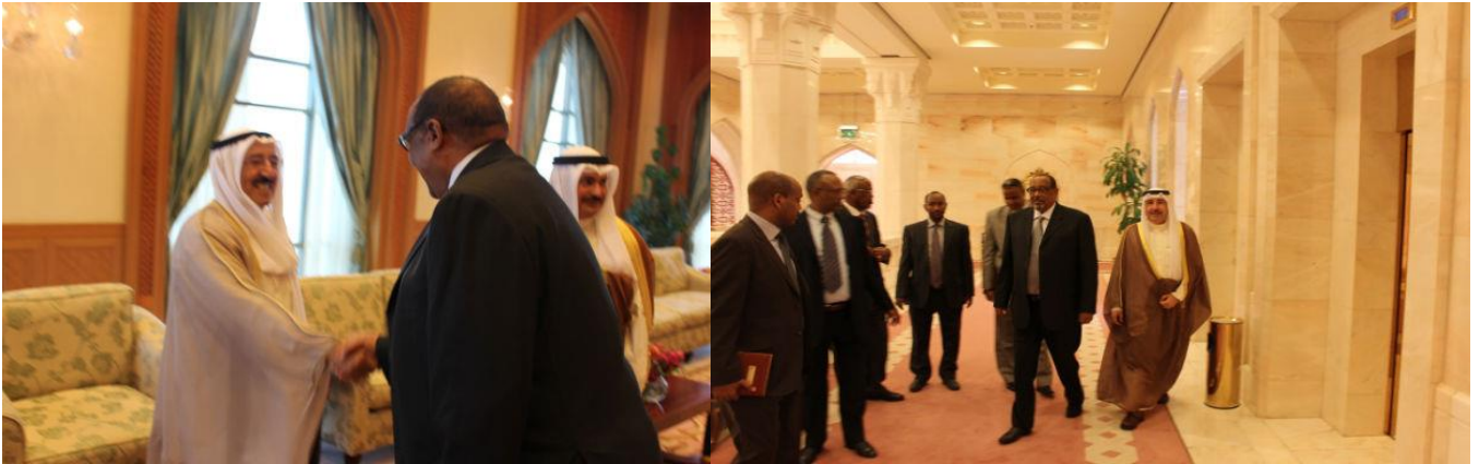
Amiirka Kuwait Sh Sabaax iyo Weftigii Maxdaxweyne Silanyo

La kulankayagii amiirka dalka Kuwait, waxa iiga muuqatay in amiirku ahaa nin waayeel ah oo haatan aakhirul cimri taagan. Laakiin, wuxuu ahaa nin Soomaalida jecel. Ma aha keliya dadka reer Somaliland balse guud ahaanba wuxuu ahaa nin isirka Soomaalida ah aad u jecel.