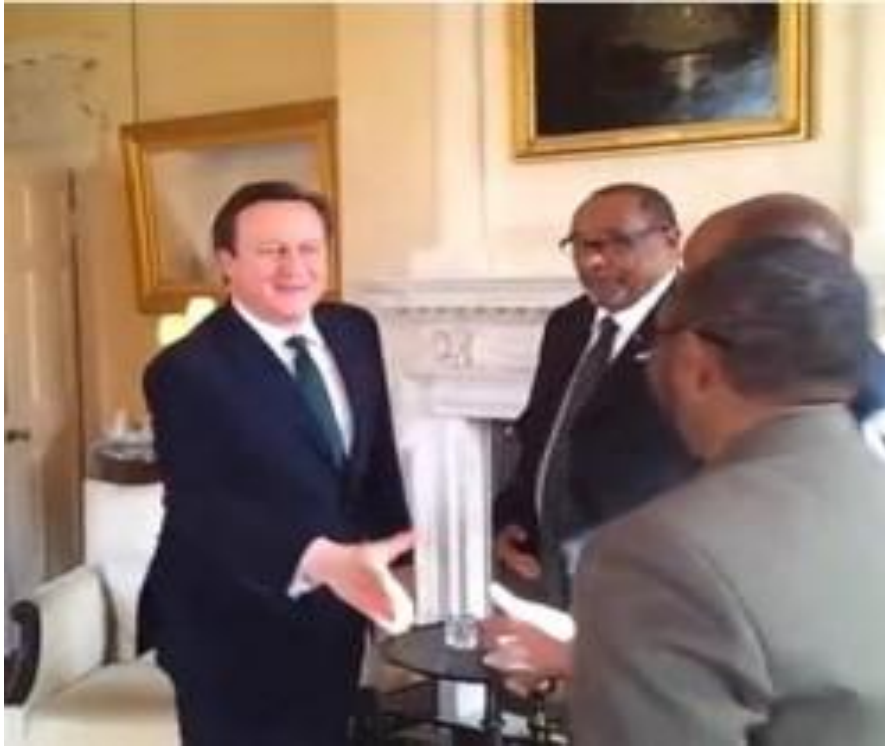
Kulankii Raysal Wasaaraha Ingiriiska iyo weftigii Madaxweyne Silanyo

Maalin Arbaca ah, 17-kii Abril 2013-kii, Waxay ahayd markii ugu horreysay taariikhda ee madaxweyne ka socda Somaliland uu la yeesho ra'iisal wasaare xukuma Boqortooyada Ingiriiska! Waxay ahayd dhacdo taariikh ku leh dalka Ingiriiska oo ahayd aaskii iyo baroordiiqdii Mrs. Margaret Thatcher, haweenaydii ugu horraysay (xagga dumarka) ee dalka Ingiriiska ra'iisal wasaare ka noqota.