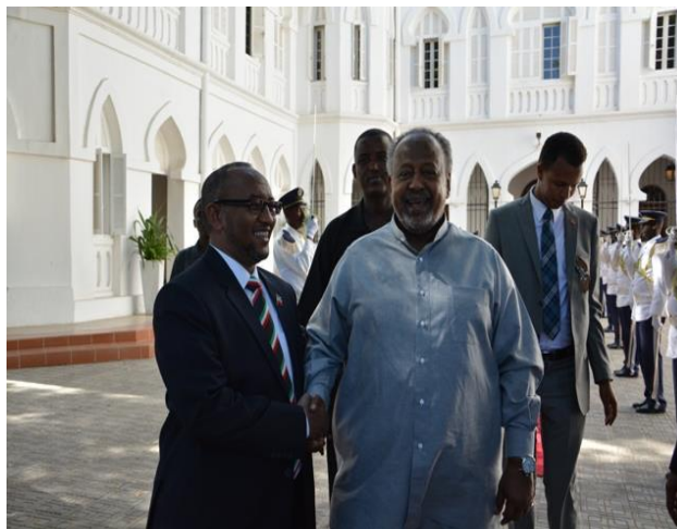
Weftigii Madaxweyne Geelle iyo Weftigii Somaliland

Waxay ahayd Nov|3|2010 markii madaxweyne Silanyo safarkii ugu horreeyay ee uu debadda ugu baxo booqasho rasmi ahna ugu kicitimay Jamhuuriyadda Jabuuti markii uu casuumad ka helay madaxweyne Ismaaciil Cumar Geelle, waxaanan ka mid ahaa weftigii madaxweynaha.