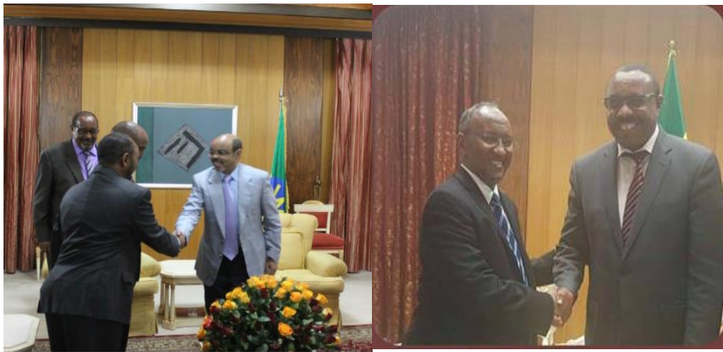
Labadii Ra'iisal Wasaare ee u kala danbeeyay Ethiopia iyo Weftigii Somaliland

Madaxweyne Silanyo ayaa safarkii labaad Dec 9, 2010 waxa uu ku tegay dalka Itoobiya, isla markaana waxaan ka mid ahaa weftigiisa. Waxa annu safarkani ii ahaa farsad aan mar labaad hoggaamiye dal kula kulmo. In kasta oo annu sidii madaxweynaha Djibouti, ra'iisal wasaaraha Itoobiya nagaga hor iman madaarka, haddana wuxuu noo soo diray ku-xigeenkiisii Xayle Marmaya—oo geeridiisii ka dib ka dhaxlay ra'iisal wasaaranimadii. Kaddibna waxa naloo gelbiyey qasriga dalka looga taliyo, halkaas oo uu nagu sugayey Males Zanawi.