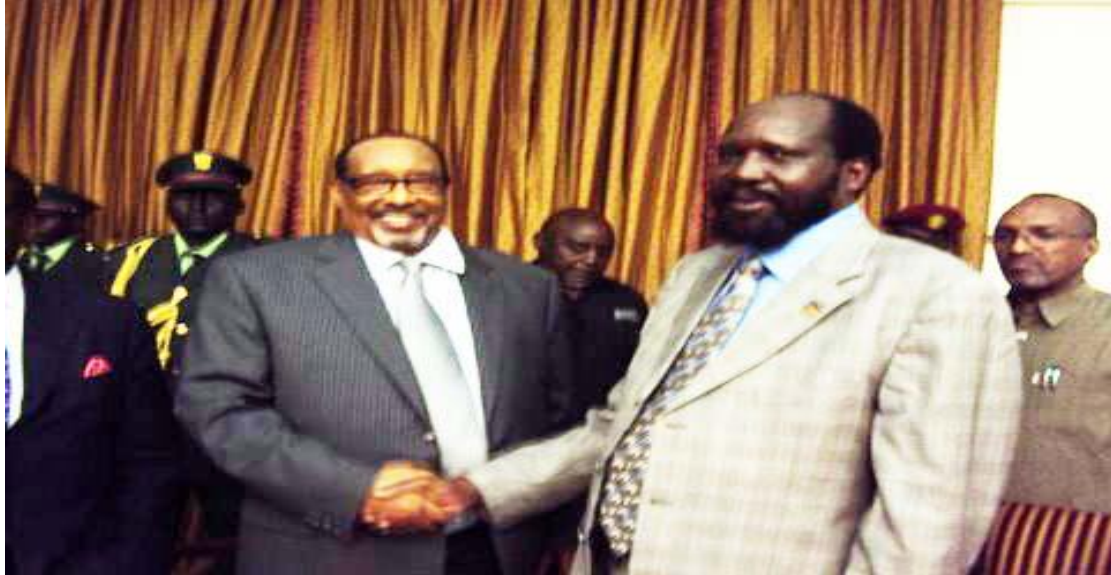
Weftigii Madaxweynaha Somaliland iyo South Sudan

Waxa aannu ka qayb galnay caleemasaarkii madaxbannaanida dalka Koonfurta Suudaan, maadaama oo ay dabeecadda siyaasadda ee dalkaa dhalanayay iyo dalkaygu ay isu-ekaansho ka dhexaysay. Waxaanay noo lahayd muhiimad weyn dadka Somaliland iyo dawladdaba. Waxa aannu uga qayb galnay si mug leh, iyaguna waxay noo soo dhoweeyeen si aad u wanaagsan. Waxa aannu jaanis u helnay in aan la kulanno madaxweynaha Koonfurta Suudaan iyo ku xigeenkiisa, waxaana ay noo ballanqaadeen xidhiidh wanaagsan iyo isgarabsi. Balse cagaba iskumay taagin oo dhalashadii waxa weheliyay dagaallo sokeeyo oo ka qarxa iyo khilaaf siyaasadeed oo naafeeyay.