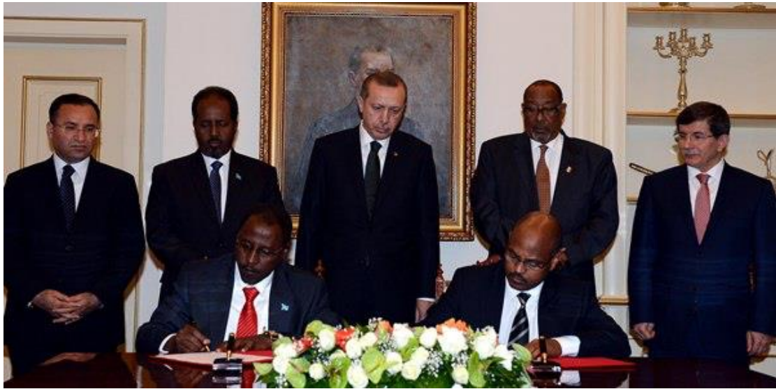
Saxeexa Heshiiska Somaliland iyo Soomaliya. Waxa taagan Madaxweynayaasha Somaliland, Turkiga iyo Soomaaliya.

Markii labaadna Soomaaliya waxaannu si dadban ugu kulannay dalka Imaaraadka Carabta. Shirkaasina waxa uu gogolxaadh u ahaa shirkii dambe ee aannu ku yeelannay Magaalada Istanbul/Ankara ee dalka Turkiga ee Xasan Sheekh iyo madaxweyne Axmed Silanyo yeesheen, ee heerkiisu mid madaxweyne ahaa.